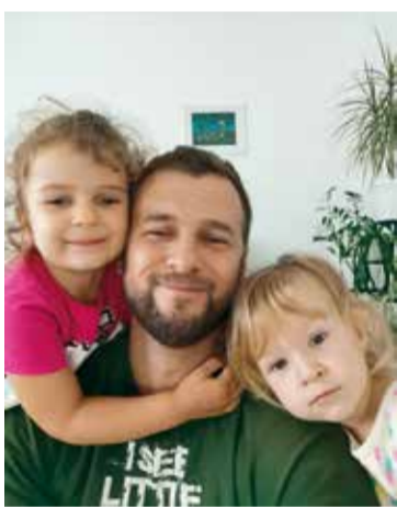
A legjobb helyen, apa nyakában