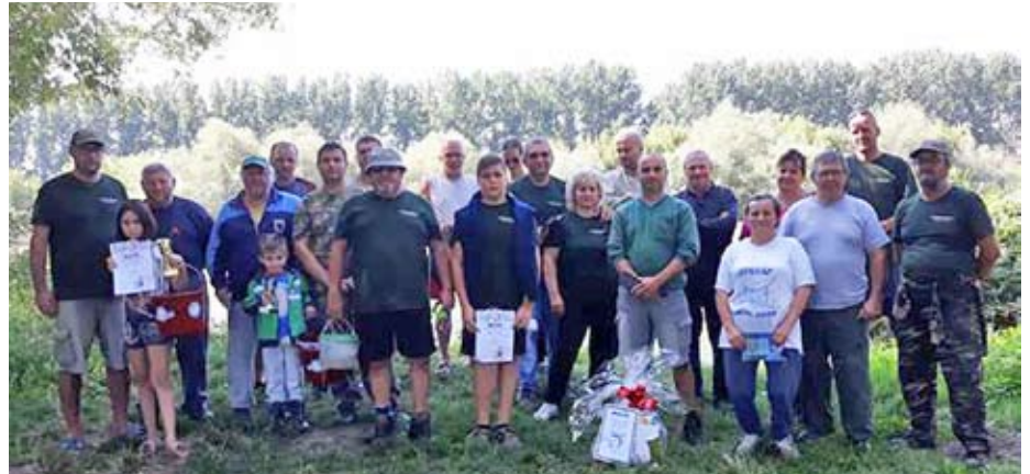
A csorvási horgászok a Kettős-Körös mellett, 2017 szeptemberében

Szeptember 8-9-én Csökmön rendezték meg a már hagyományos elnök-titkári versenyt, melyen a csorvási szervezet is képviseltette magát. A Körösvidéki Horgász Egyesületek Szövetsége (KHESZ) tagegyesületeinek horgászvezetői találkoztak a vízparton, ahol a remek hangulat, a baráti beszélgetések és persze a közös szenvedély, a horgászat erősítette a horgásztársadalmi kapcsolatokat. A megmérettetésen a 92 tagszervezetből ezúttal 52 egyesület képviselte a Körösvidék horgászait - a csorvásiak a középmezőnyben végeztek. Szinte ugyanebben az időben, szeptember 9-10-én izgalmas versenynek adott helyet a Kettős-Körös békési szakasza - az egyesületi szervezésű, egyéni, 25 órás versenyen ragado-