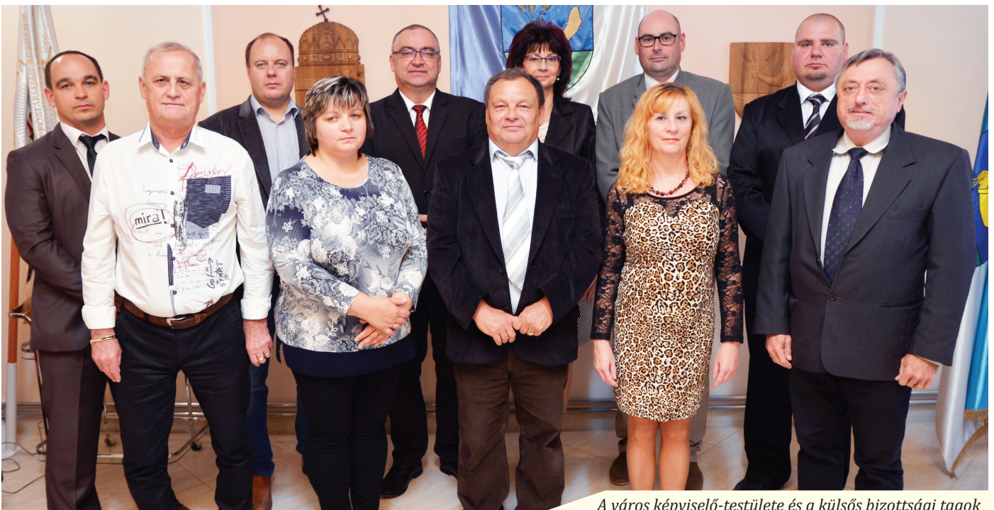
A város képviselő-testülete és a külsős bizottsági tagok