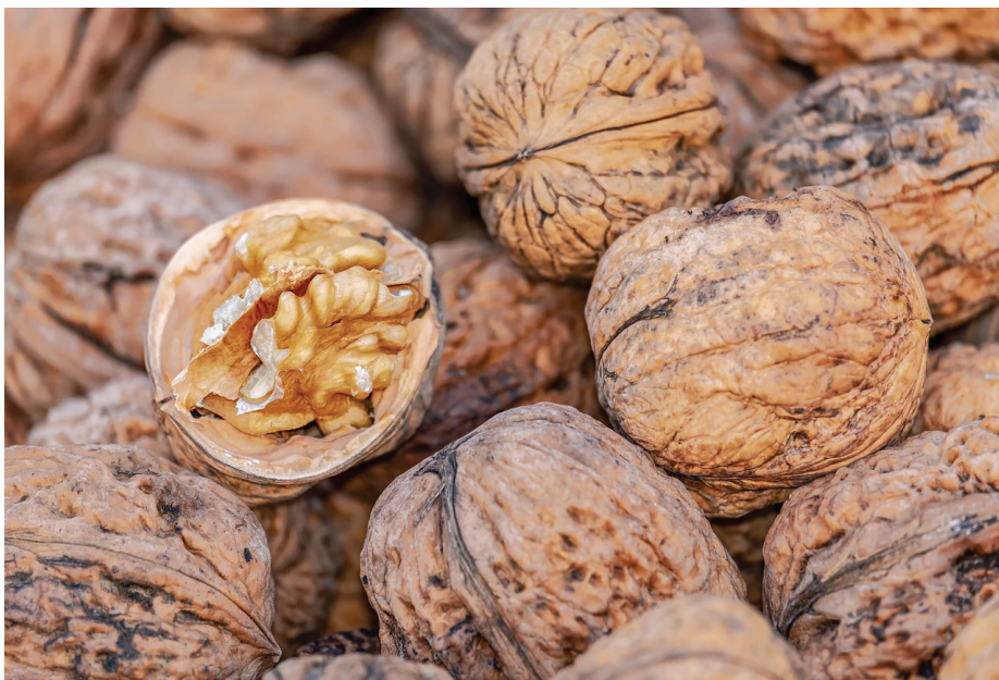
Feleannyi dió termett mint tavaly

Az állattenyésztés terén: szarvasmarha telepünkön éves szinten stabil az átvételi ár, javulnak a tejtermelési hozamaink, de az eredménytermelési képessége még mindig nem a kívánatos szinten van: 100 ft feletti önköltség mellett 96 ft az alapár. A támogatás mellett örülhetünk a nullás eredménynek. A sertésnek idén illik profitot termelnie, most jobb pozícióban van ár oldalán, viszont óriási veszélyei vannak. Egyik